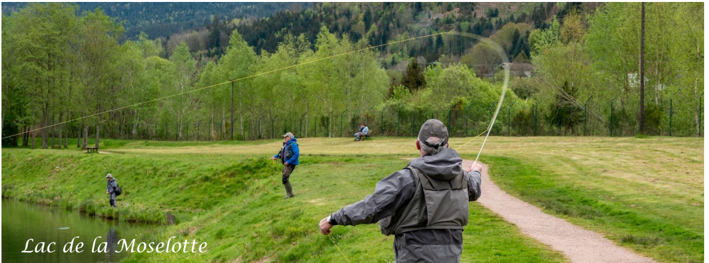
Lac de la Moselotte