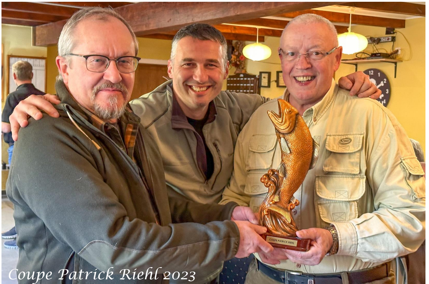
Coupe Patrick Riehl 2023