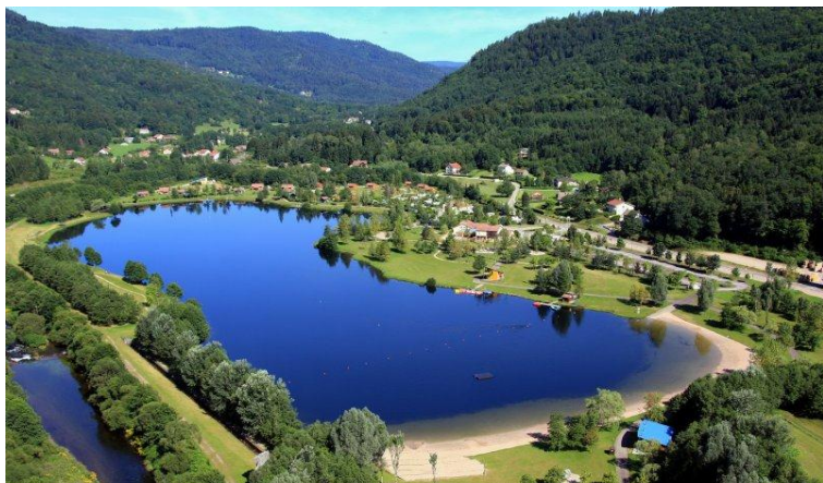
den Séi aus der Loft gesin

Den Flyfishing Club aus Lëtzebuerg huet sech den Week – end vum 12. an 13. Mée 2012 op den Weë gemeet fir an d'Vogesen fëschen ze fueren. Den lac de la Moselotte ass 9 ha grouss an läit idyllesch teschent den Birger an engem 23 ha groussen Naturpark. Mir profitéieren bei dëser Sortie ëmmer vun der Geleenheet fir an den Chalets'ën déi direkt um Séi geleën sinn ze iwwernuechten, esou bid sech eis d'Méiglechkeet Owes esou laang ze fëschen ewei et eis Spaass mécht, ouni mussen un d'Heemrees ze denken. Dodernieft sinn déi schon legendär Grillowender zu Saulxure all Joër op een Neis een groussen Moment deen mir op keen Fall mëssen wëllen an esou haten sech dann och eng gudd zwanzég Memberen anfond fir zwee wonnerschéin Deg an beschter Komerodschaft zesummen ze erliewen.